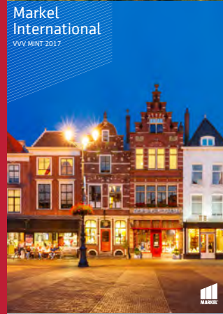
Markel International VVV MINT 2017