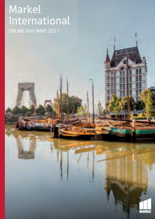
Markel International ONLINE AAV MINT 2017