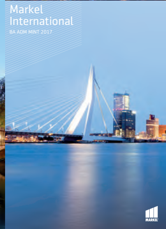
Markel International BA ADM MINT 2017