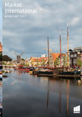
Markel International BA ADV MINT 2017