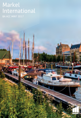
Markel International BA ACC MINT 2017