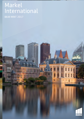
Markel International BEW MINT 2017