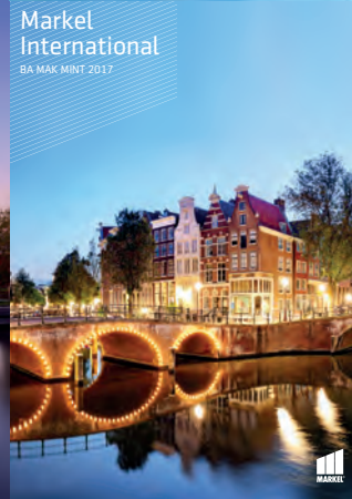
Markel International BA MAK MINT 2017