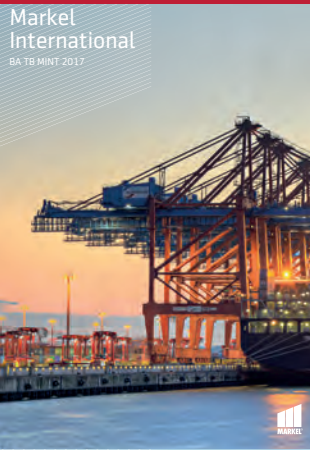
Markel International BA TB MINT 2017