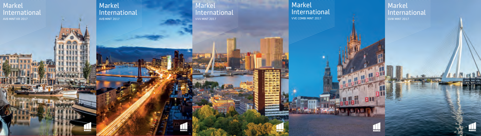
Markel International AVB MINT KR 2017