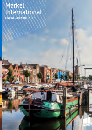
Markel International ONLINE ABT MINT 2017