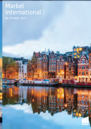
Markel International BA TP MINT 2017