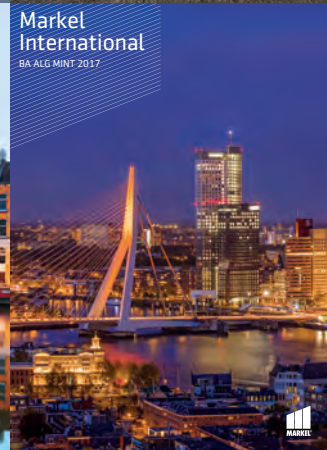
Markel International BA ALG MINT 2017