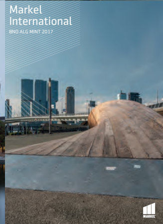
Markel International BNO ALG MINT 2017